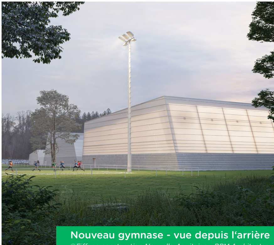
Nouveau gymnase - vue depuis l'arrière

La nouvelle salle sera par ailleurs très peu énergivore avec une structure toilée, non chauffée.