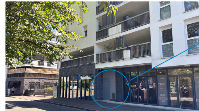
Entrée parking, résidence Filigrane

La procédure pour le plein d'essence est la même que celle pour les véhicules CITIZ. Pour le lavage des véhicules, merci de vous rapprocher du service des moyens généraux.