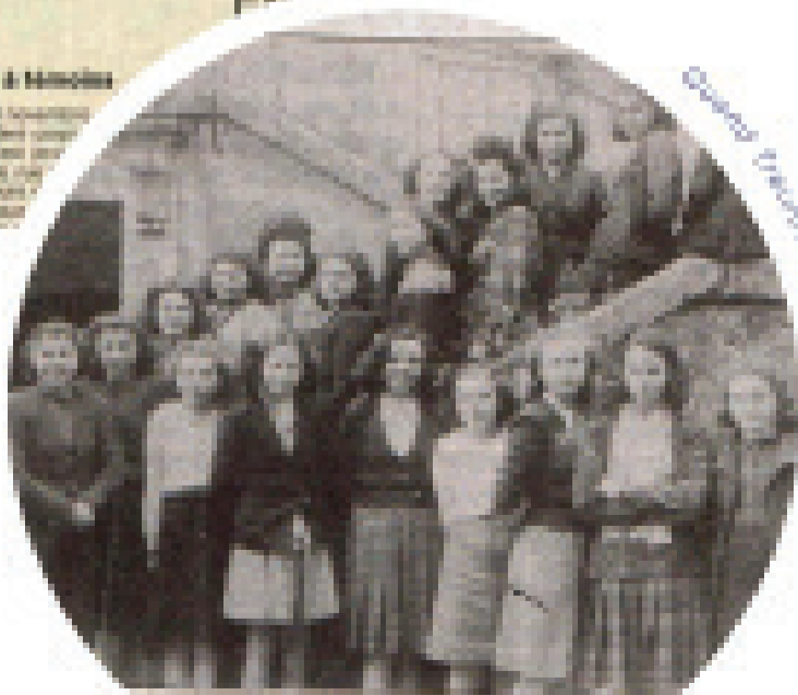
Quand Trevion était un collège