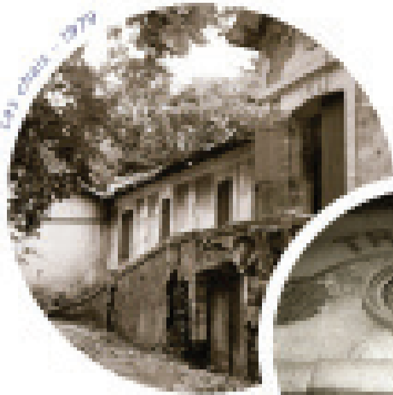
Les cours - 1979