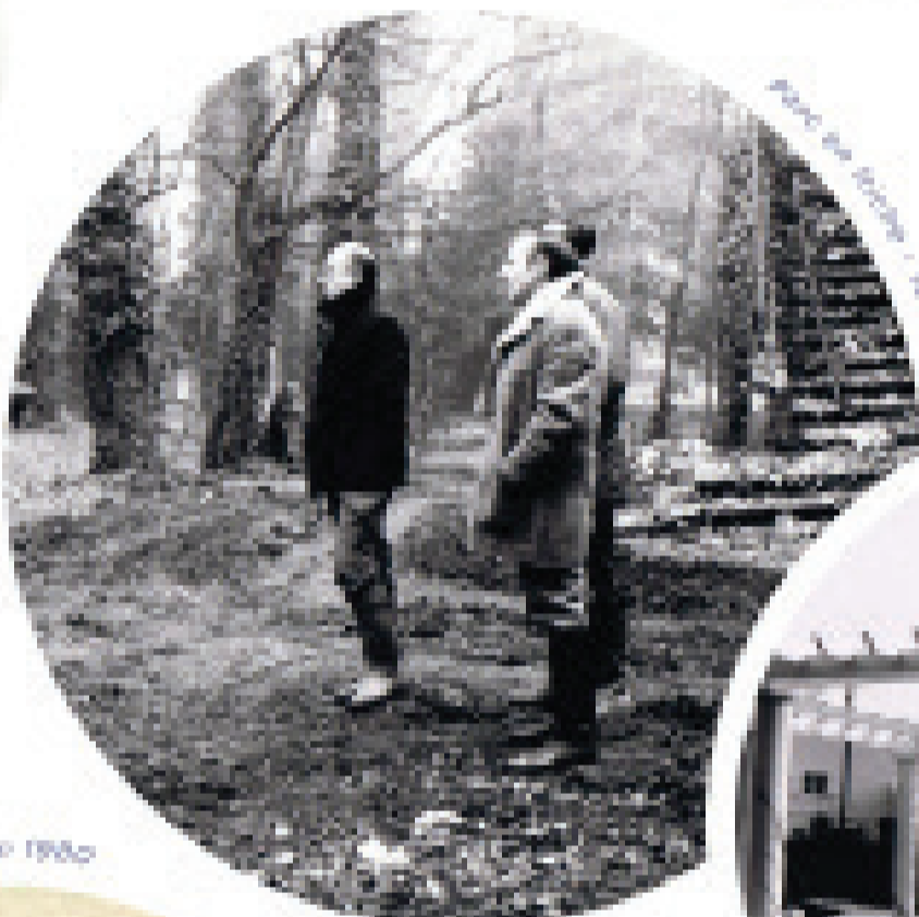
Marche aux herbes - 1991