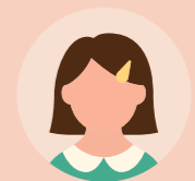
Alyssa, en CP

« Nos déchets sont triés pour pouvoir ensuite faire du terreau et planter des végétaux. On préserve la planète et c'est bien. Sinon, quand on sera grand on n'aura plus d'eau, on n'aura plus rien. Des CM2 sont venus dans notre classe pour nous présenter le compost. »