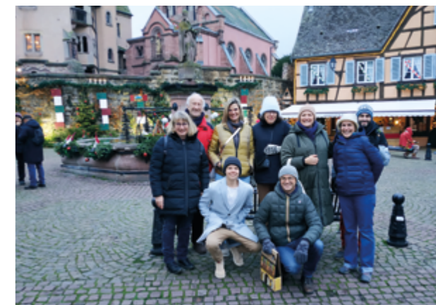
Des membres de l'association des Jumelages de Bruges en voyage à Umkirch, à l'occasion du marché de Noël en décembre dernier. Ici, de passage à Eguisheim.

« Bruges a cette chance d'avoir bâti un jumelage solide, grâce à des bénévoles investis et des familles d'accueil qui ont tissé des liens d'amitié avec les Allemands, les Espagnols et les Écossais. Le jumelage plus récent avec Leven, situé au nord d'Édimbourg, a démarré fort avec de très belles rencontres, mais a été coupé dans son élan par la crise sanitaire et le Brexit. Cette année, nous espérons donner un second souffle à ce jumelage et continuer de mobiliser de nouvelles familles brugeaises pour faire vivre durablement les Jumelages internationaux de Bruges. »