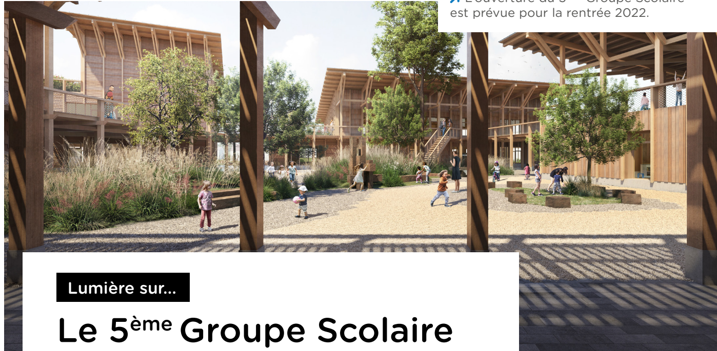
➔ L'ouverture du 5 ème Groupe Scolaire est prévue pour la rentrée 2022.